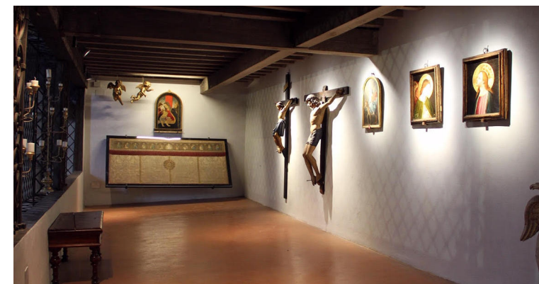
Ospedale S. Maria Nuova - Firenze

ACOSI : una nuova realtà che raccorda ospedali storici monumentali italiani, autentici giacimenti culturali, poco noti ma ben attivi nell'evoluzione culturale e sociale dell'assistenza e della cura.