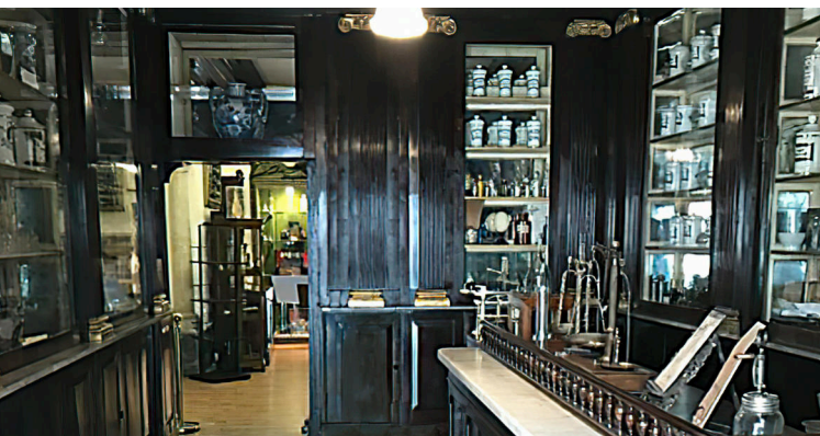
Ospedale degli Incurabili - MAS - Napoli - Farmacia Storica