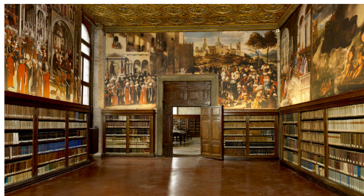
Ospedale Civile Ss. Giovanni e Paolo - Venezia - Museo di Storia della Medicina

ACOSI : una nuova realtà che raccorda ospedali storici monumentali italiani, autentici giacimenti culturali, poco noti ma ben attivi nell'evoluzione culturale e sociale dell'assistenza e della cura.