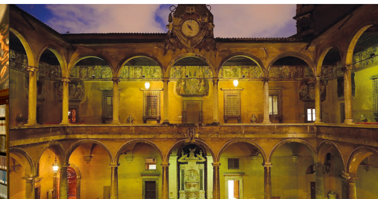
Ospedale Santo Spirito in Sassia - Roma - Chiostro del commendatore